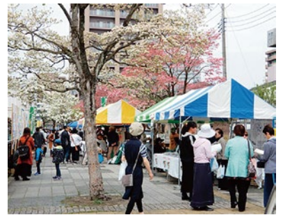
花みずきフェスタ2019の様子。「秋のフェスタ」の実施が期待されます

2022年8月に複合商業施設が開業され、LRTの試運転も始まるなど再開発が進んでいるJR宇都宮駅東口。ハード的な激変が生じている駅東地域において、長年にわたり民間主体によるまちづくり活動を続けている団体の皆さんにお話を伺いました。