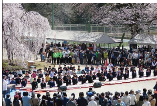
孝子桜まつりでは児童による演劇やコンサートなど様々な催しが実施されます

〒321-0341 栃木県宇都宮市古賀志町 583 宇都宮市立城山西小学校内 問い合わせ: 宇都宮市役所経済部観光交流課 TEL. 028-632-2436