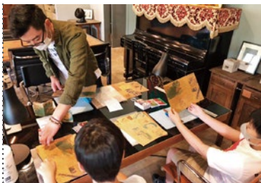
絵本作りワークショップやポストカード販売なども行う

ねぎ図書」が2021年9月にリリース。4種類の紙を使って印刷後、全て手製本で作成しています。怪獣みたいな虫歯を主人公にしたジョーノ。物語は日常の生活を日記感覚で比喩を交えながら描かれています。