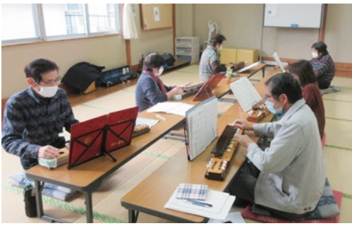
真剣に練習に打ち込むメンバーのみなさん