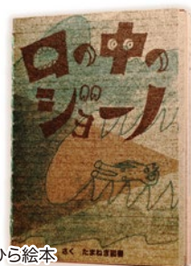
手のひら絵本 口の中のジョーノ 一冊 600円(税込)

活動拠点: OHYA BASE 購入場所: 「Lapis08」 「Punto大谷町食堂」他イベントにて 問い合わせ: たまねぎ図書 SNS: https://www.instagram.com/onionbooks/