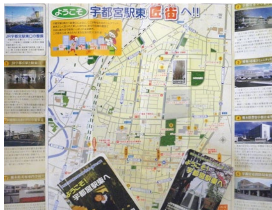
ポケットサイズの地域マップ。ほしい方は、事務局までご連絡ください

宇都宮市宿郷1-20-8 (株) いがらし不動産 内 E-mail: info@ehm21.com